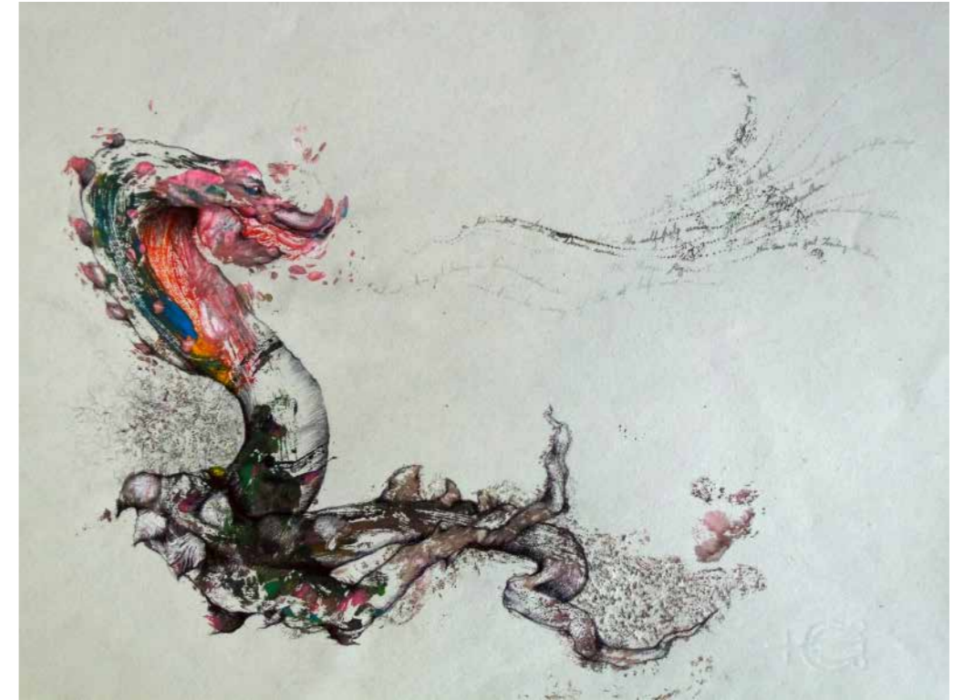
El enemigo de la autoayuda